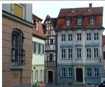
Rokokohaus mit Stuckfassade