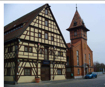
der Ochsenhof / Reichsstadtmuseum

Bei der Neugestaltung des Marktplatzes stieß man bei Grabungen auf ein Gräberfeld aus dem 8.-10. Jahrhundert. Man kann die Ausgrabung durch 4 „Archäologische Fenster“ von oben betrachten